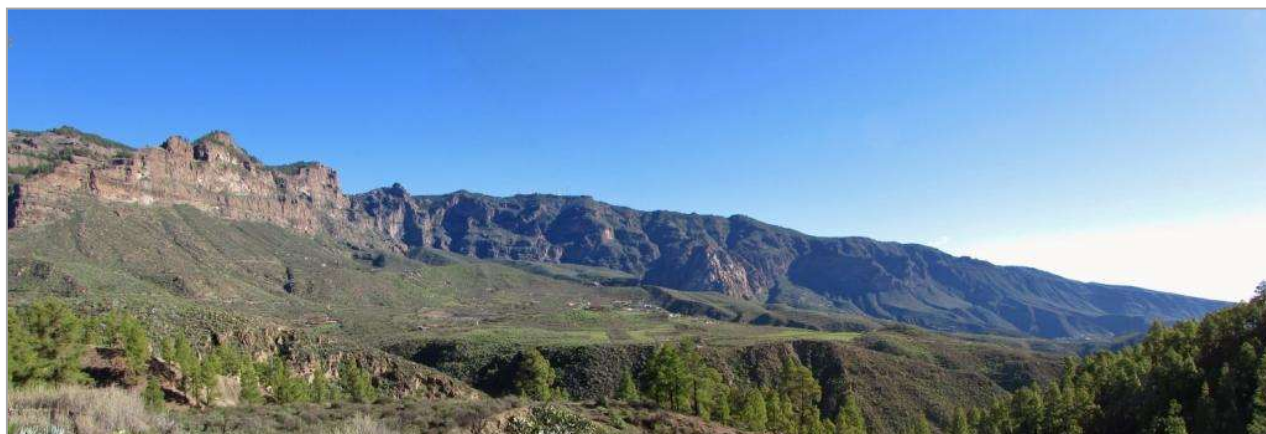
Depuis le S 50, dans la montée à Cruz Grande

GPS 6C : Nous proposons un court aller-retour (facultatif) permettant de rejoindre, en 5 min environ, un col Degollada de Rosiana puis sur la droite (au Sud-est) un bel endroit pour faire une pause, les vues sur le Barranco de Tirajana y sont magnifiques.