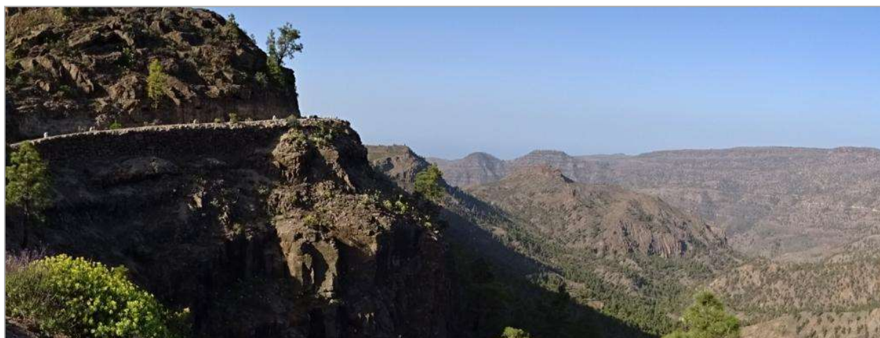
Degollada de la Manzanilla : vue sur la forêt de Pilancones,