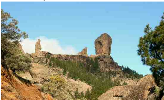
Roque Nublo au lever du soleil