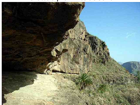
Grotte à proximité de Soria